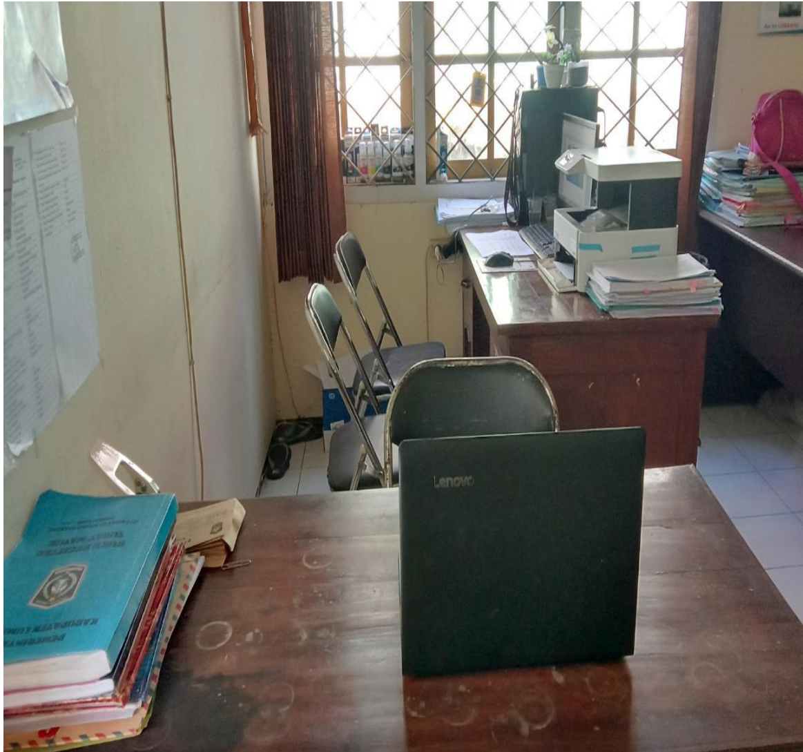
( Tampilan Pelayanan Informasi Kecamatan Kedungjajang )