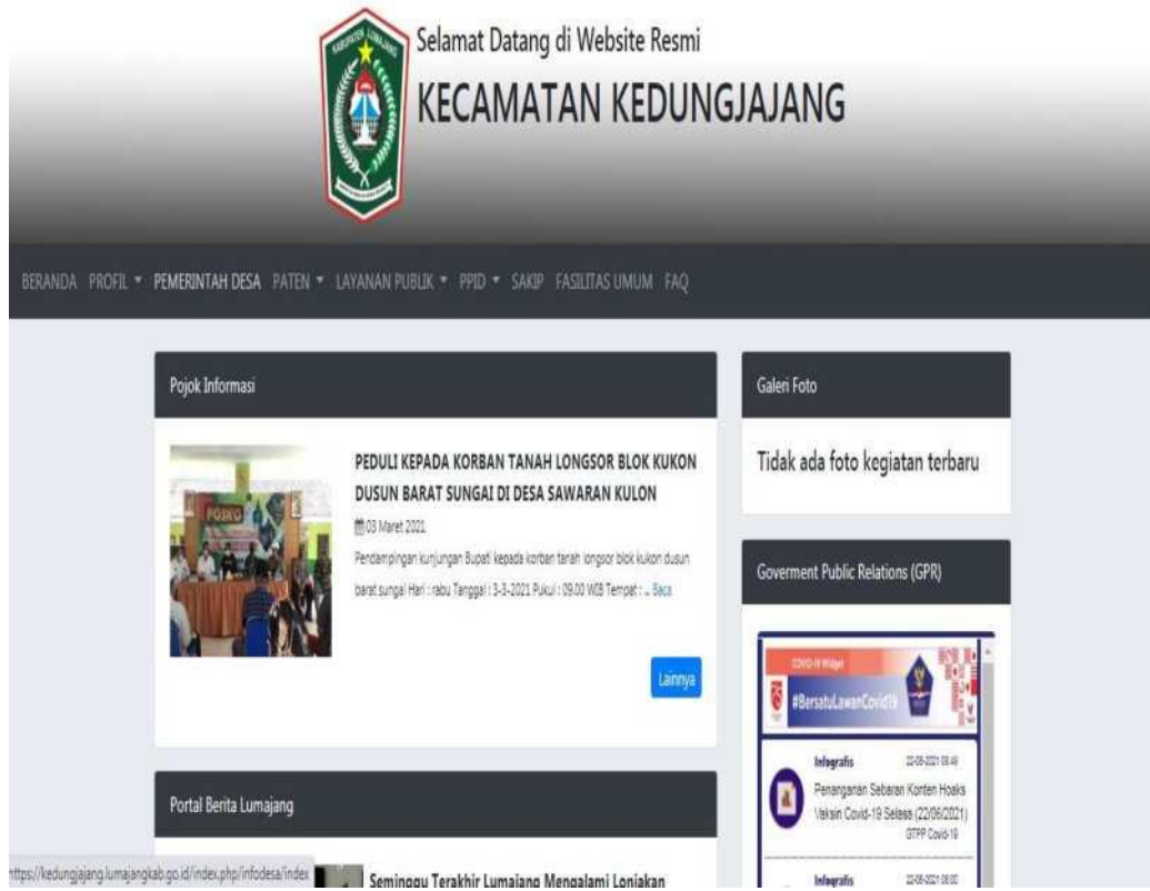
( Tampilan Website Kecamatan Kedungjajang Kab. Lumajang )