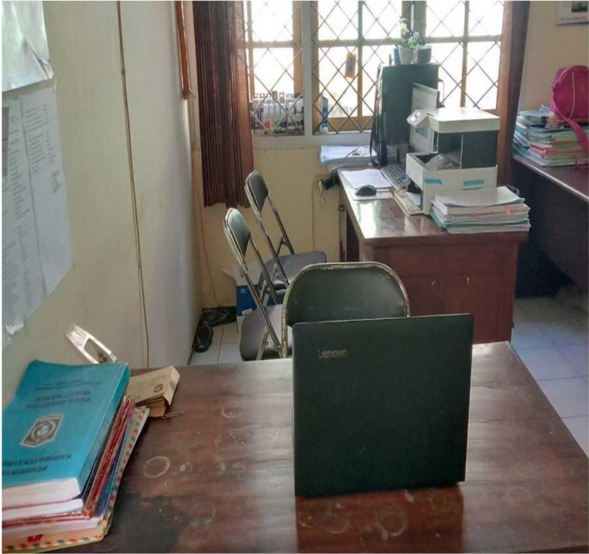
( Tampilan Pelayanan Informasi Kecamatan Kedungjajang )